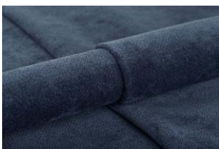
15 Blue Night