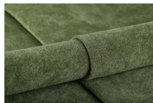
6 Green Grass